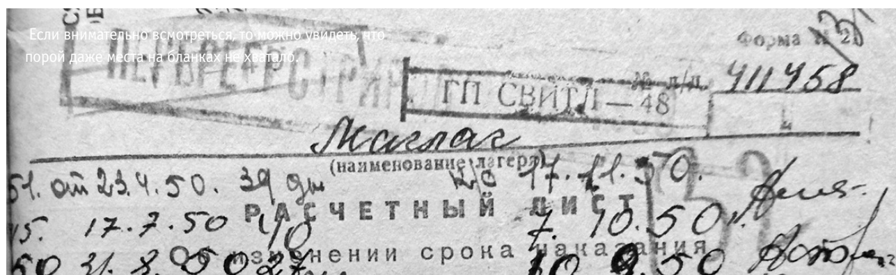
Если внимательно всмотреться, то можно увидеть, что порой даже места на бланках не хватало.