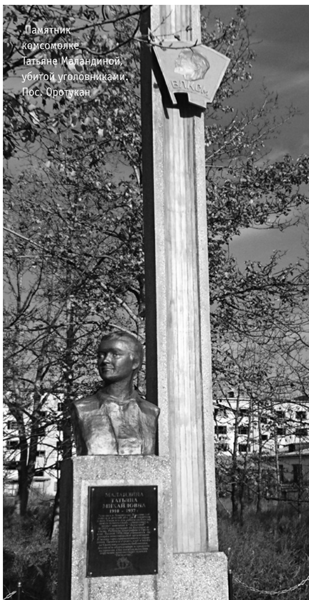
Памятник комсомолке Татьяне Маландиной, убитой уголовниками. Пос. Оротукан