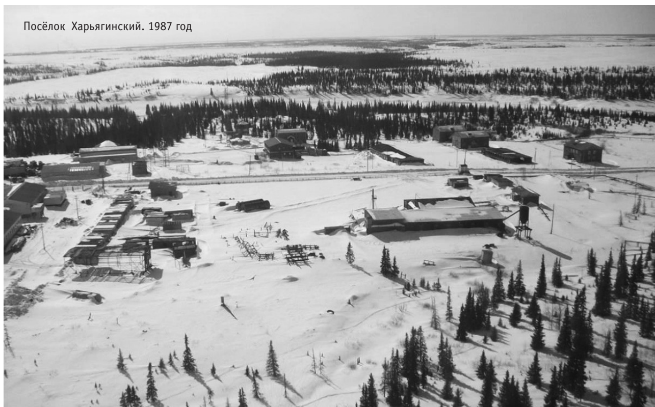
Посёлок Харьягинский. 1987 год

В 1985 году генеральный директор ПО «Архангельскгеология» Юрий Алексеевич Росси-