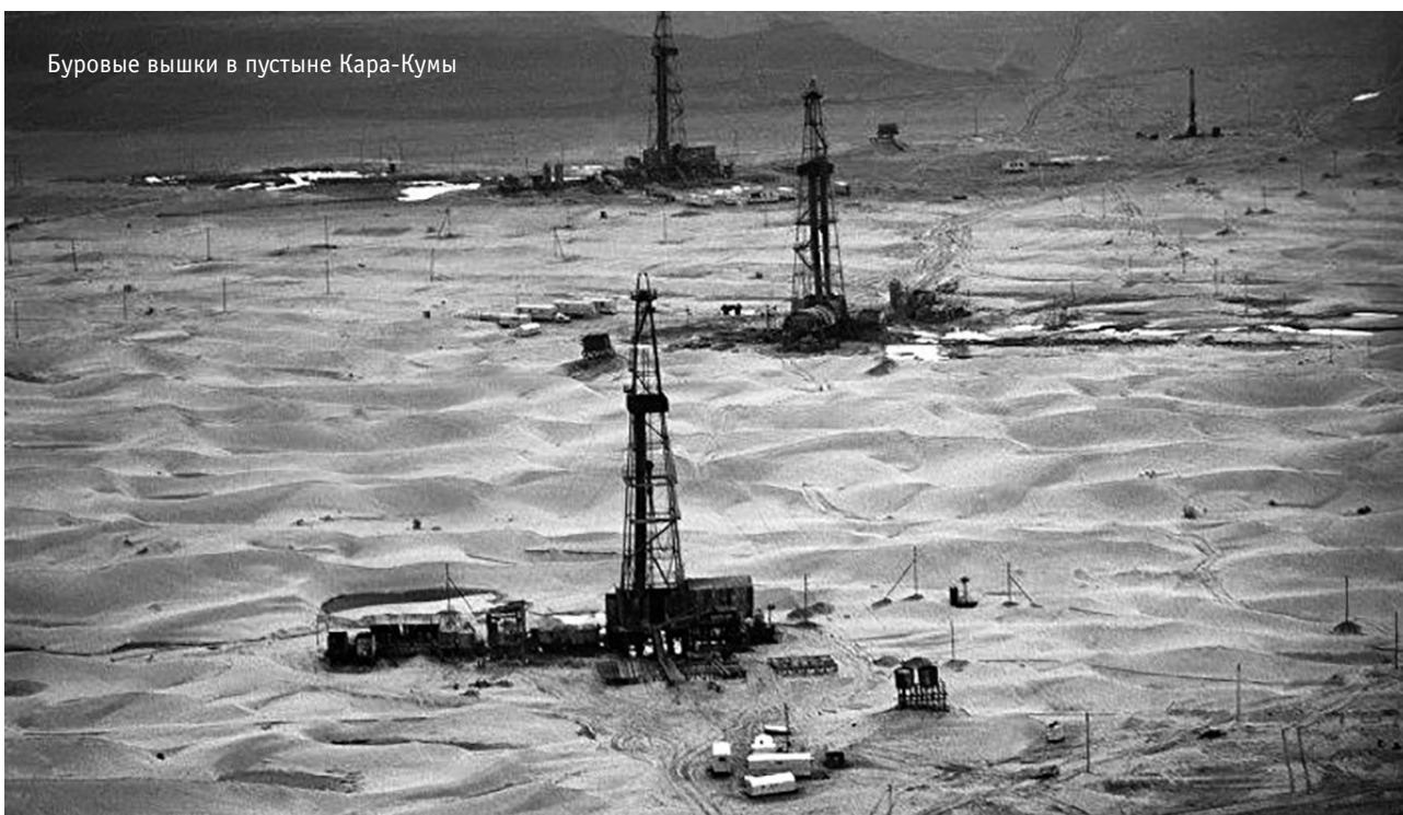
Буровые вышки в пустыне Кара-Кумы

тяжёлое ранение, его удалось эвакуировать. Он перенёс несколько операций, врачи спасли ему жизнь.